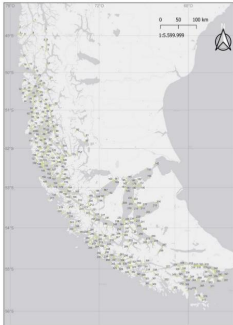
Figura 1. Procedencias de pesca del recurso centolla en la Región de Magallanes entre 2007 y 2022.