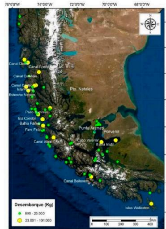
Figura 61. Distribución de las procedencias de pesca de luga roja en la macrozona sur-austral. Las áreas con color amarillo representan en conjunto el 42% de los desembarques. Región de Magallanes. Año 2019.