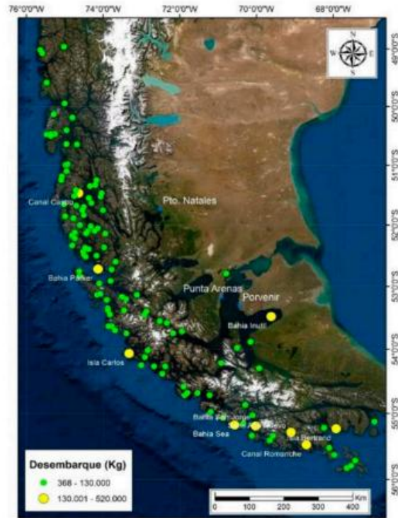
Figura 57. Distribución de las procedencias de pesca de erizo en la macrozona sur-austral. Las áreas con color amarillo representan en conjunto el 38% de los desembarques. Región de Magallanes. Año 2019.